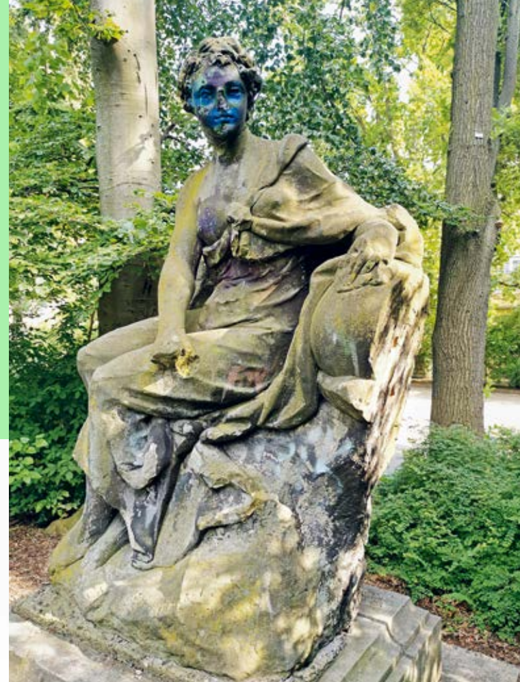
Urania, Skulptur von dem Gebäude der Akademie, heute im Heinrich-von-Kleistpark, ca. 1750, Fachbereich Grünflächen des Straßen- und Grünflächenamtes, Bezirksamt Tempelhof-Schöneberg von Berlin

DEINE OHREN WERDEN AUGEN MACHEN. IM RADIO, TV, WEB.