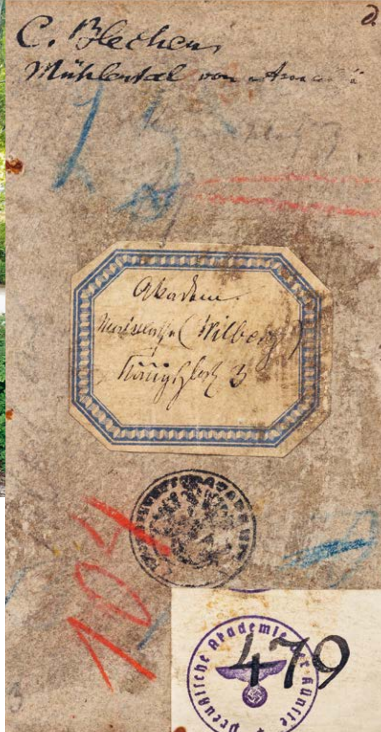
Rückseite von Carl Blechens Mühlental bei Amalfi , 1829, Akademie der Künste, Berlin; KS-Blechen 479