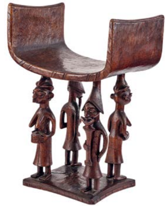
Afrikanischer Hocker aus dem Nachlass von Paul Robeson, Akademie der Künste, Berlin; KS-Museale-Sammlung 720