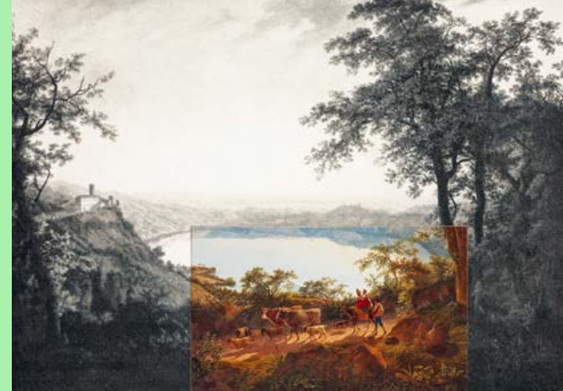
Peter Ludwig Lütke, Lago di Nemi , 1796, Akademie der Künste, Berlin; KS-Gemälde MA 468 (Montage)

The audio guide, produced together with students, tells stories from the perspective of various exhibition objects without revealing details. Visitors set out on a trail of discovery to try and locate the exhibits in the exhibition.