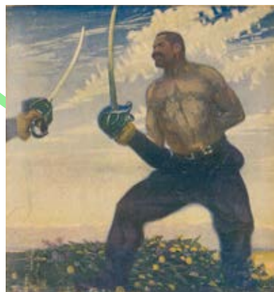
Titelblatt der Zeitschrift Jugend mit Fritz Erlers Der Fechter , Bd. 1, Heft 18, 10. Jg., 1905