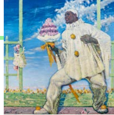
Fritz Erlers, Schwarzer Pierrot , 1908, Akademie der Künste, Berlin; KS-Gemälde MA 221, Foto: Oliver Ziebe