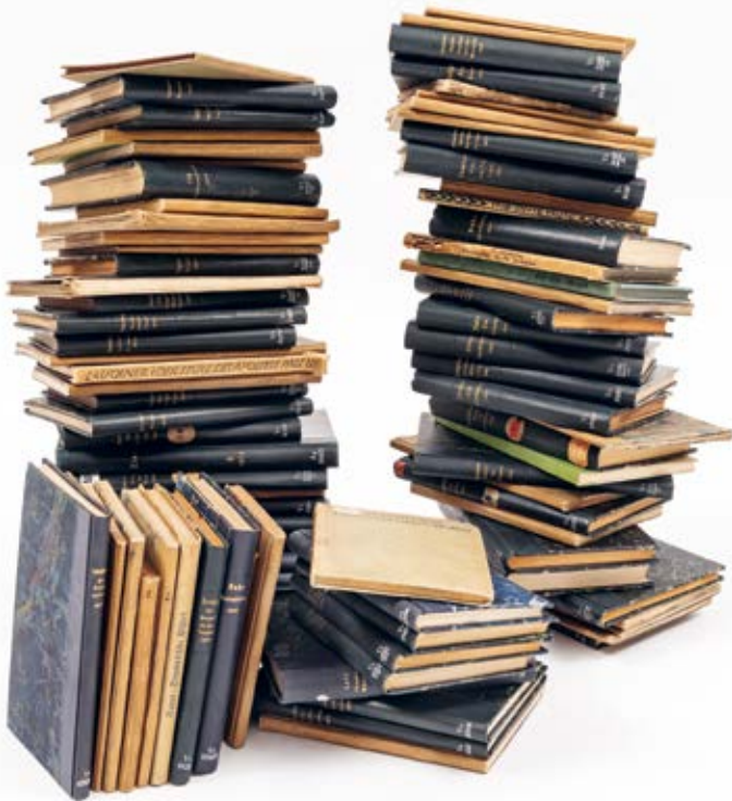
Fragment der Nachlass-Bibliothek von Alfred Kerr in der Akademie der Künste, Berlin