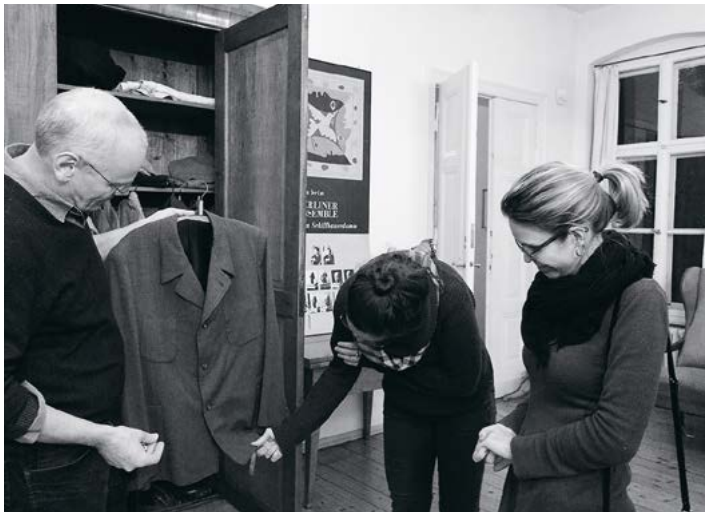
Beim Besuch des Brecht-Weigel-Museums, 2016